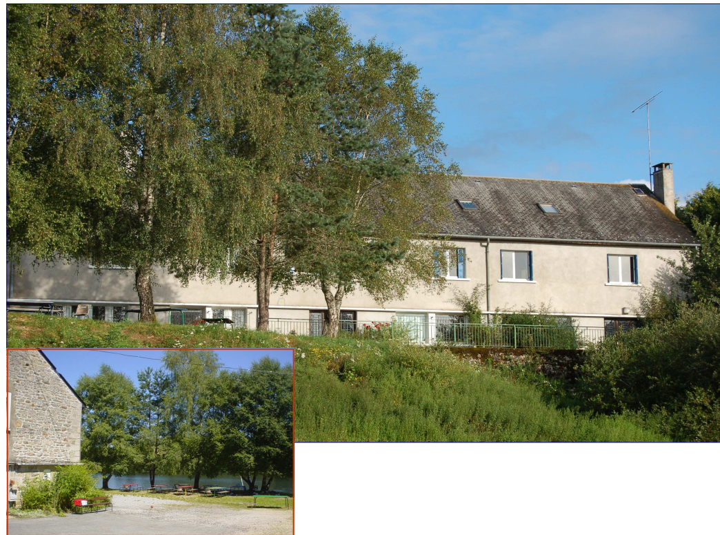
Centre d'hébergement "VOILCO III" Viam sur Vézère

Pour mariages, anniversaires, week-ends sportifs..