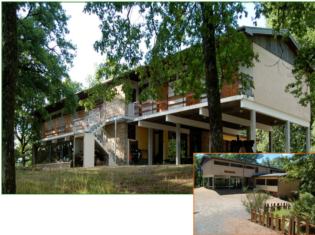
Centre d'hébergement "VOILCO I" St Priest de Gimel

Pour mariages, anniversaires, week-ends sportifs..